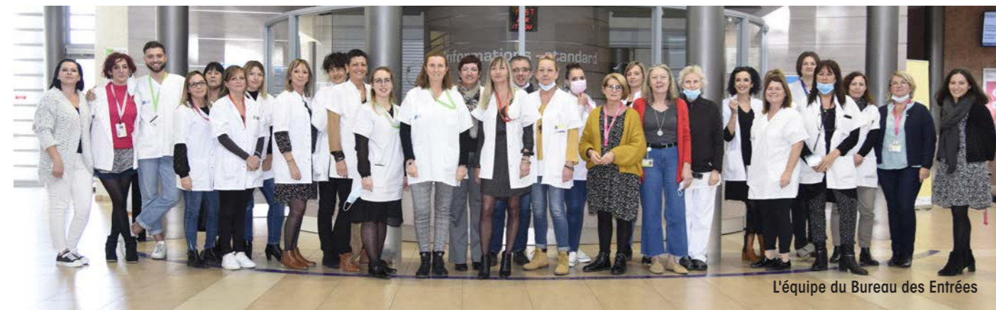
L'équipe du Bureau des Entrées

Un accueil de qualité, une bonne identification du patient et une