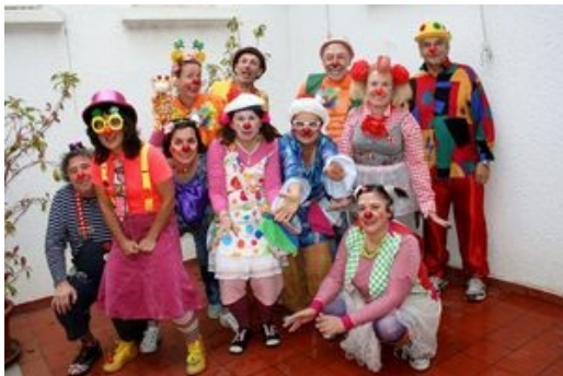
Terrain2Je - Clowns de relation