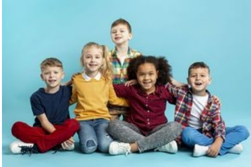
Les blouses roses