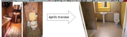
Changement Baignoire en receveur extra plat.

Exemple d'atelier équilibre dans le but de prévenir les chutes.