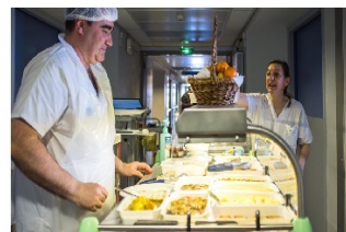
Les patients ont toujours le droit de dire ce qu'ils aiment dans leur repas, avec un choix « menu de l'hôtel » de quoi enthousiasmer les patients : « C'est glorieux, une grande ! », « Je n'ai plus d'appétit que dire les plats barquette », « Il faut rendre leur humour » vous avez raison l'équipe ! ...